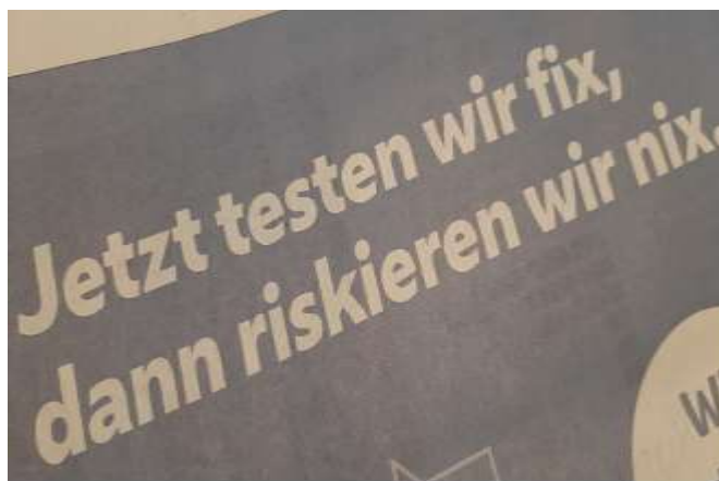
Dieser inserierte Aufruf zum Massentest gibt vor, dass nach dem Test alles sicher sei. Hauptsache der Euro rollt ...

In Kauf genommen im wahrsten Sinne des Wortes wird von Regierung, Konzernen und Gesundheitsbehörden die Gefahr des neuerlichen Anstiegs der Covid-19 Fälle.