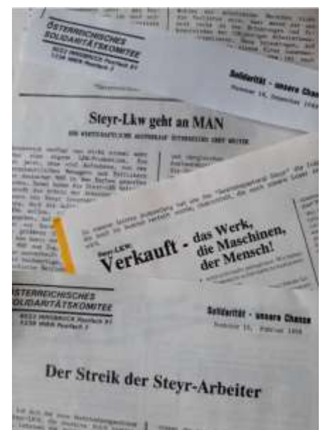
Seit mehr als 30 Jahren kämpfen die Arbeiter*innen um ihren Standort

Creditanstalt Bankverein, CA-BV) mit rund 17.000 Beschäftigten im Jahr 1980. Ende der 1980er Jahre wurde begonnen, den Konzern zu filetieren und Teile zu privatisieren und an ausländische Großkonzerne auszuverkaufen.