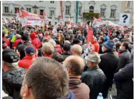
Dieses Flugblatt verteilte das Österr. Solidaritätskomitees bei der Protestkundgebung